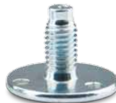
Vite per piedino regolabile antivibrante per elettrodomestici Screws for antivibrating levelling foot for household appliance